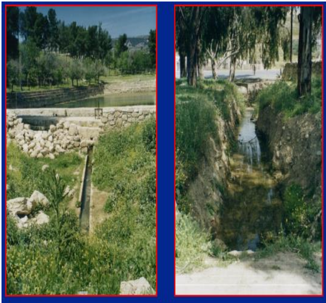
Plate (Photo) 1. A Photo of Qantara Spring Watershed.